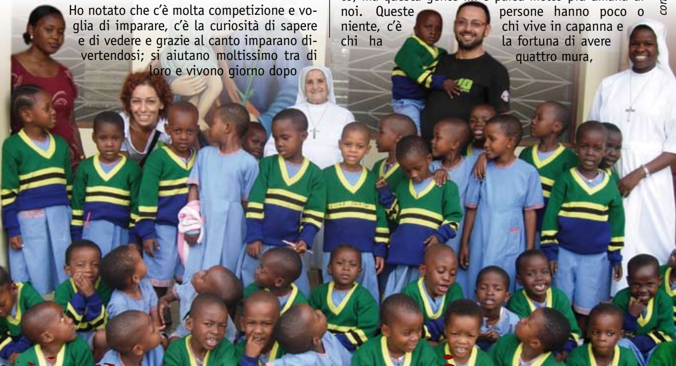
continua a pag. 2

Il cuore delle Suore è davvero grande e una di loro, mia coetanea, mi ha detto: "Il Signore ci accompagna, ci guida e veglia su di noi, giorno dopo giorno e noi non possiamo far altro che ringraziarlo. Qui, in questo paese povero, le persone, non avendo tutte le comodità dell'occidente, vivono di fede e ogni giorno per loro è un giorno nuovo, in cui forse mangeranno o forse no, ma il poco che hanno lo condividono tra loro". Forse l'emotività ha preso in me il sopravvento, ma questa gente mi è parsa molto più umana di noi. Queste persone hanno poco o niente, c'è chi ha chi vive in capanna e la fortuna di avere quattro mura,