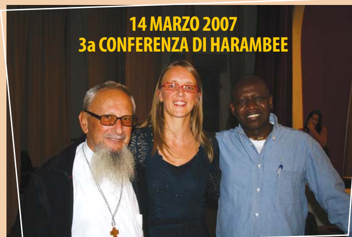
14 MARZO 2007 3a CONFERENZA DI HARAMBEE