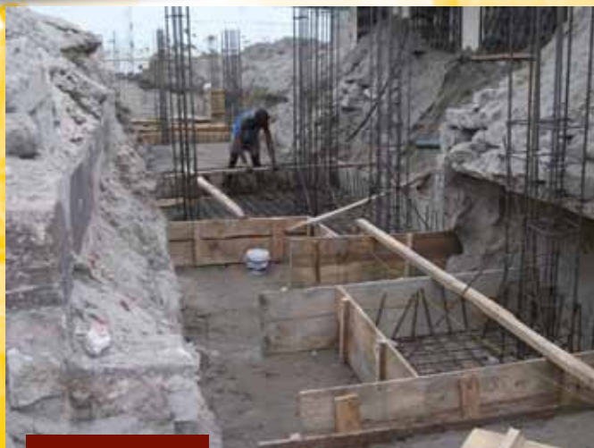
i lavori alle fondamenta