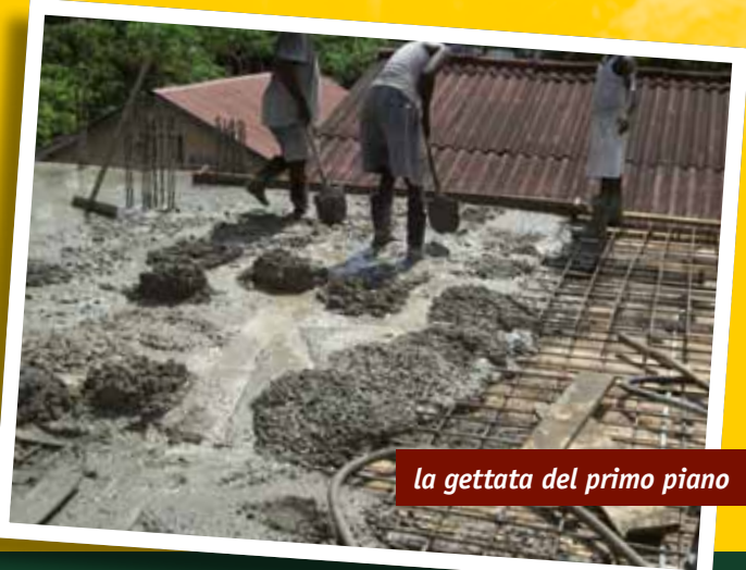
la gettata del primo piano

Il 27 novembre , nella splendida cornice di Palazzo Colleoni, a Cortenuova, si è svolto con grande successo un pranzo di solidarietà organizzato da Harambee, finalizzato alla raccolta di fondi per la costruzione della scuola elementare del quartiere di Chang'ombe, a Dar es Salaam, in Tanzania , alla quale abbiamo dedicato ampio spazio nelle pagine centrali di questo notiziario.