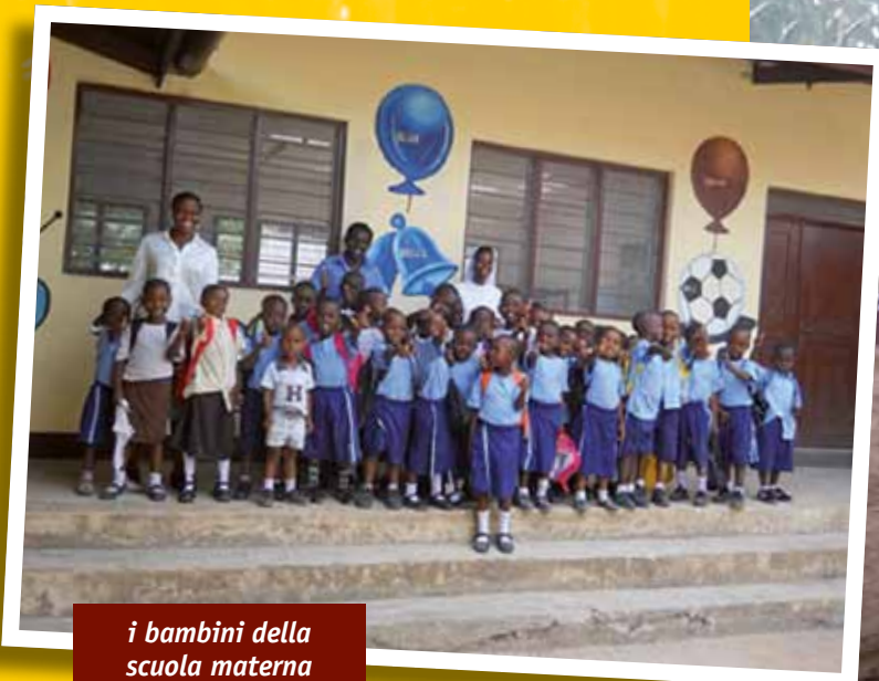
i bambini della scuola materna

tutti danno una mano per l'inizio dei lavori