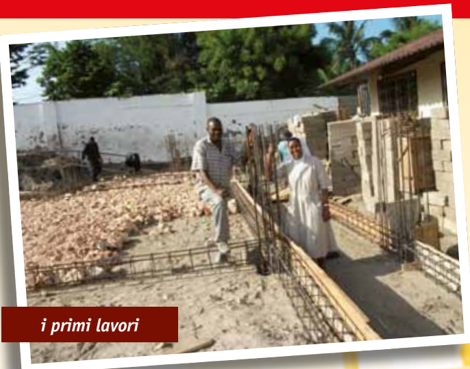
i primi lavori