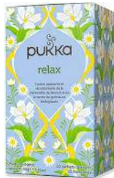
TISANA RELAX 4,90 EURO