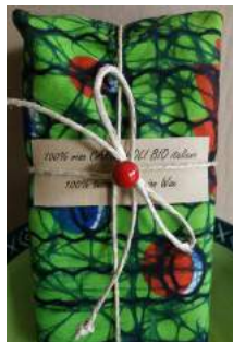
CONFEZIONE CON RISO ITALIANO BIO E TESSUTO WAX 1KG - 4 EURO