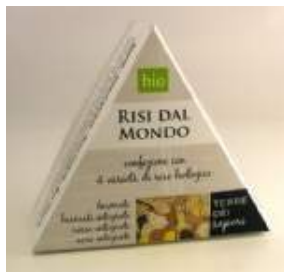
CONFEZIONE BASMATI BASMATI INTEGRALE ROSSO INTEGRALE NERO INTEGRALE 1KG - 9 EURO