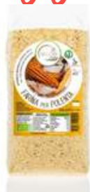
POLENTA AI MAIS ANTICHI 500G - 4,20 EURO