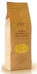
FARINA INTEGRALE DI MAIS MARANO 1KG - 3,5 EURO