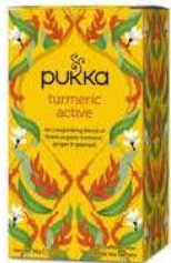
TISANA TURMERIC ACTIVE 4,90 EURO