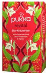
TISANA DI ERBE BIOLOGICHE 20 FILTRI 4,90 EURO