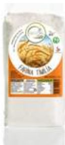
FARINA DI GRANO DURO TIMILIA 1KG - 4,20 EURO