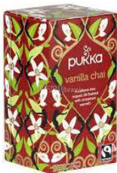
TISANA VANIGLIA E CANNELLA 20 FILTRI 4,90 EURO